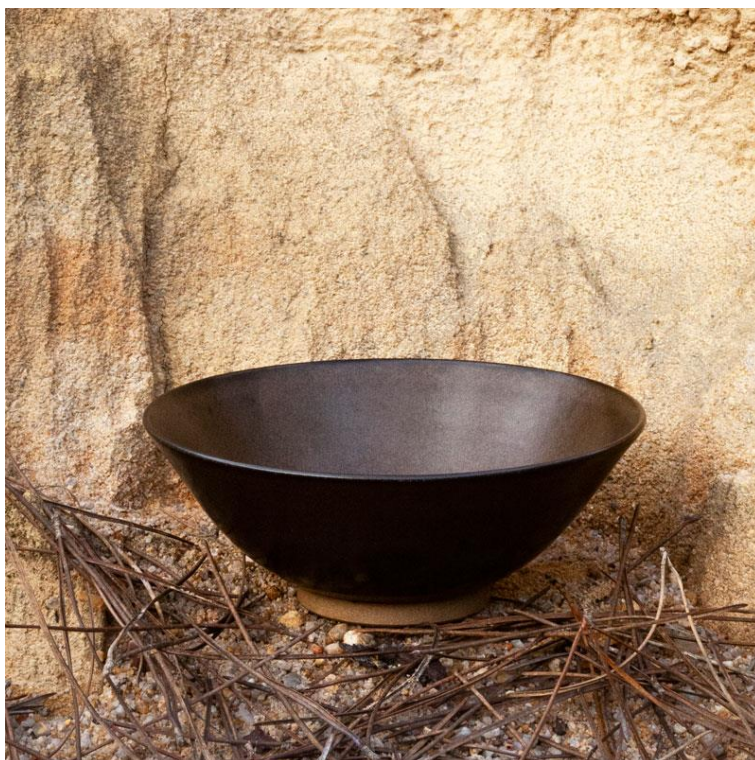
Bol céramique, Stéphanie Marcenat, crédit Pauline Turmel.

Pôle Expérimental des Métiers d'Art de Nontron et du Périgord-Limousin